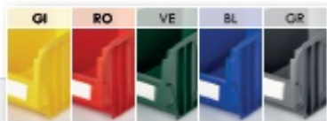
key box K2